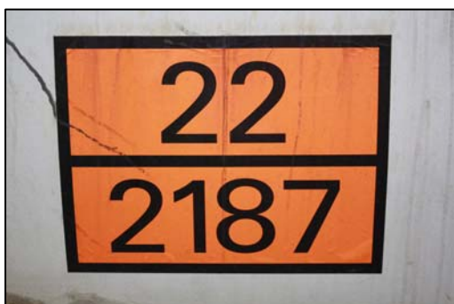
Obr. 4: Označení vozidla přepravujícího nebezpečnou látku.

Každé vozidlo převážející NL, musí být vždy řádně označeno oranžovou reflexní tabulkou, která je rozdělena do dvou částí (nahore je Kemler kód – udává, jaké nebezpečí látka představuje, dole je UN kód – 4 místné číslo, které je přiděleno každé přepravované látce).