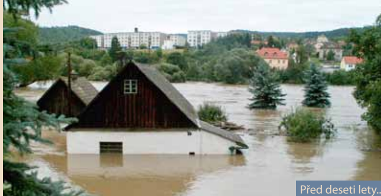
Před deseti lety...

Situace se zhoršuje, ve Středočeském kraji je vyhlášen stav nouze. Kolem čtvrté hodiny ráno začíná voda rychle stoupat, pod vodou mizí chatové osady, části obcí a silnice. V 11:45 je uzavřena zatopená silnice Zbečno-Píska, Roztoky-Branov, Roztoky-Nezabudice-Týřovice a Křivoklát-Roztoky. Plovoucí chaty, kmeny a další předměty se hromadí u mostu ve Zbečně a hrozí jeho pobožení. Před třetí hodinou odpoledne je stržen most do zbečenského lomu. Hladina řeky Berounky kulminuje po 19. hodině. V těchto chvílích vzedmutá Berounka dosahuje téměř k mostovce zbečenského mostu. Ve 22 hodin je most uzavřen.