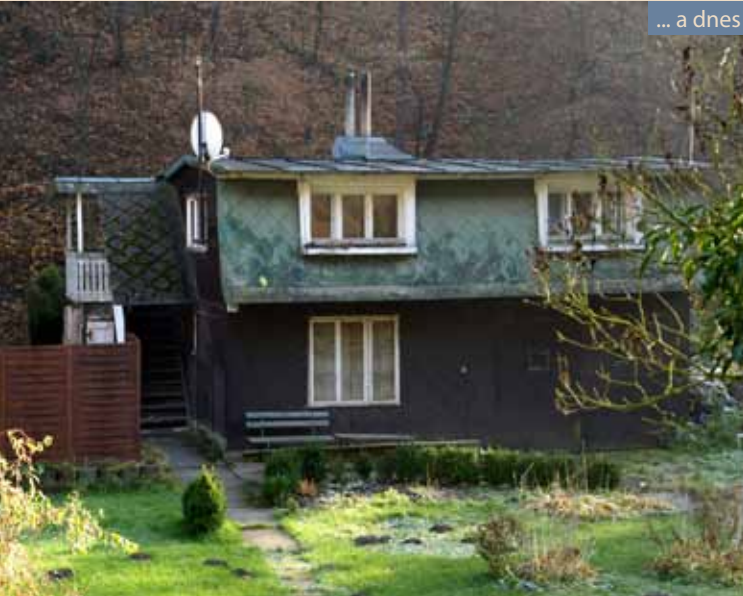
... a dnes