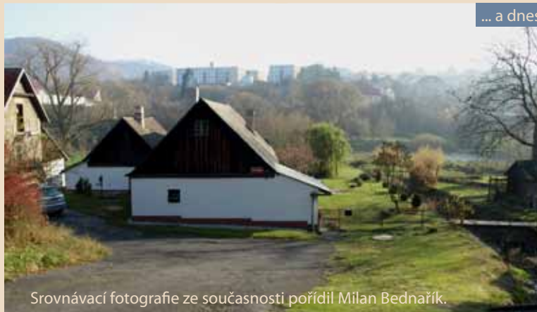
Srovnávací fotografie ze současnosti pořídil Milan Bednařík.

Profesionální i dobrovolní hasiči, záchranáři a vojáci pomáhají, kde se dá. Zachraňují majetek i ohrožené lidské životy. Například v chatové osadě Višňová zůstali odříznutí na osamoceném pevném bodě tři lidé. Hasiči z Roztok je jednoho po druhém převezli na pramici přes silný proud rozvodněné řeky do bezpečí. Přestože zachraňující hasiči jsou zkušení vodáci, po úspěšném zásahu si zhluboka oddechli: „Měli jsme co dělat.“