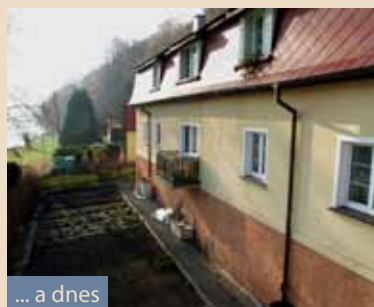
... a dnes