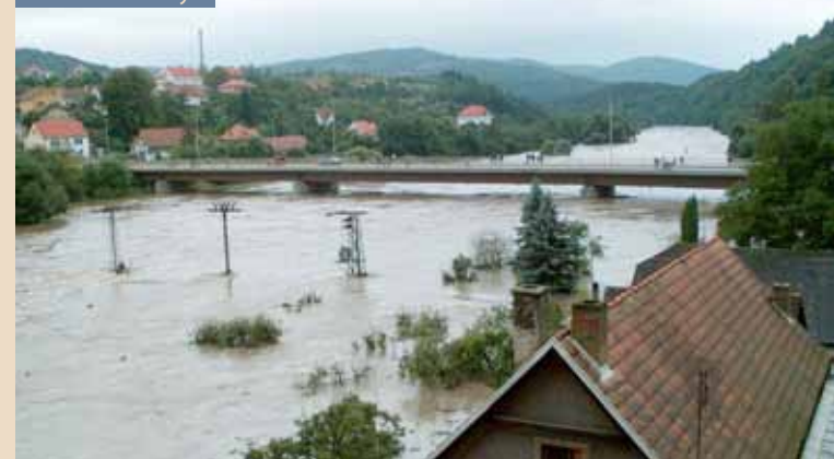
Před deseti lety...

Celkové škody způsobené povodní byly na Rakovnicku vyčísleny na téměř 200 milionů korun. Zničeno nebo poškozeno bylo 433 rekreačních objektů (celková škoda 100 milionů korun), 44 rodinných domů a 28 kilometrů komunikací. Oběti na lidských životech si povodeň naštěstí nevyžádala.