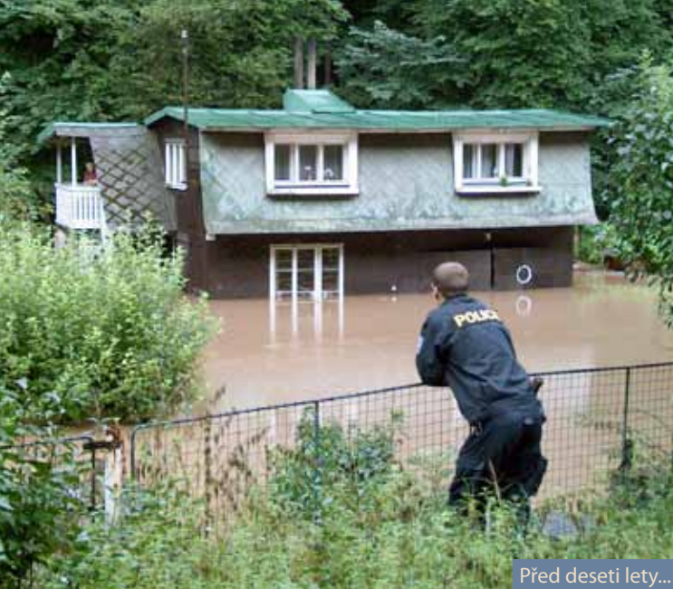
Před deseti lety...