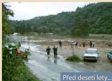
Před deseti lety...