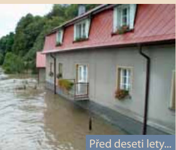
Před deseti lety...