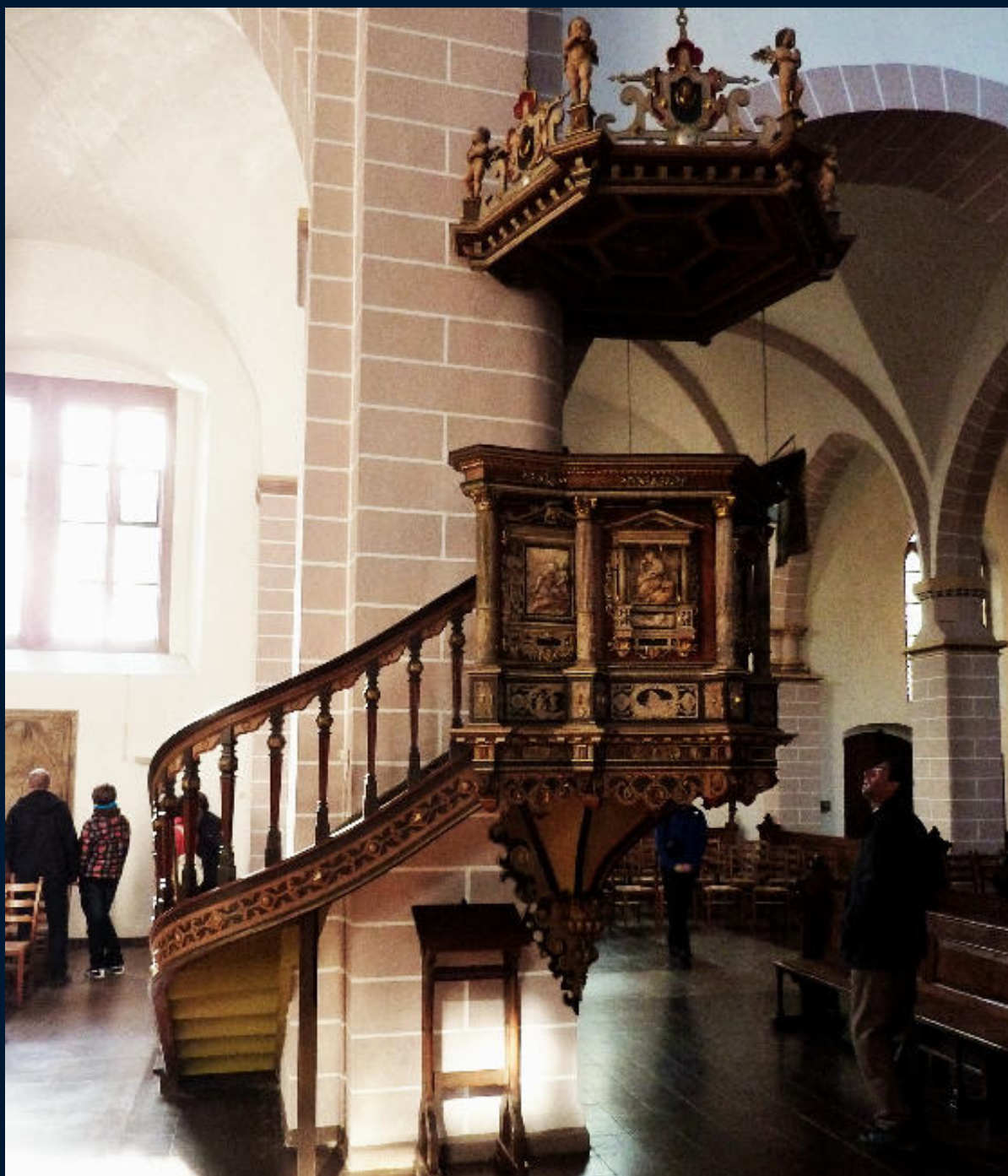
Hoxter – středověký kostel