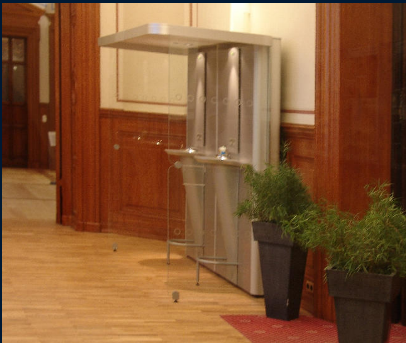
Schwerin - zámek