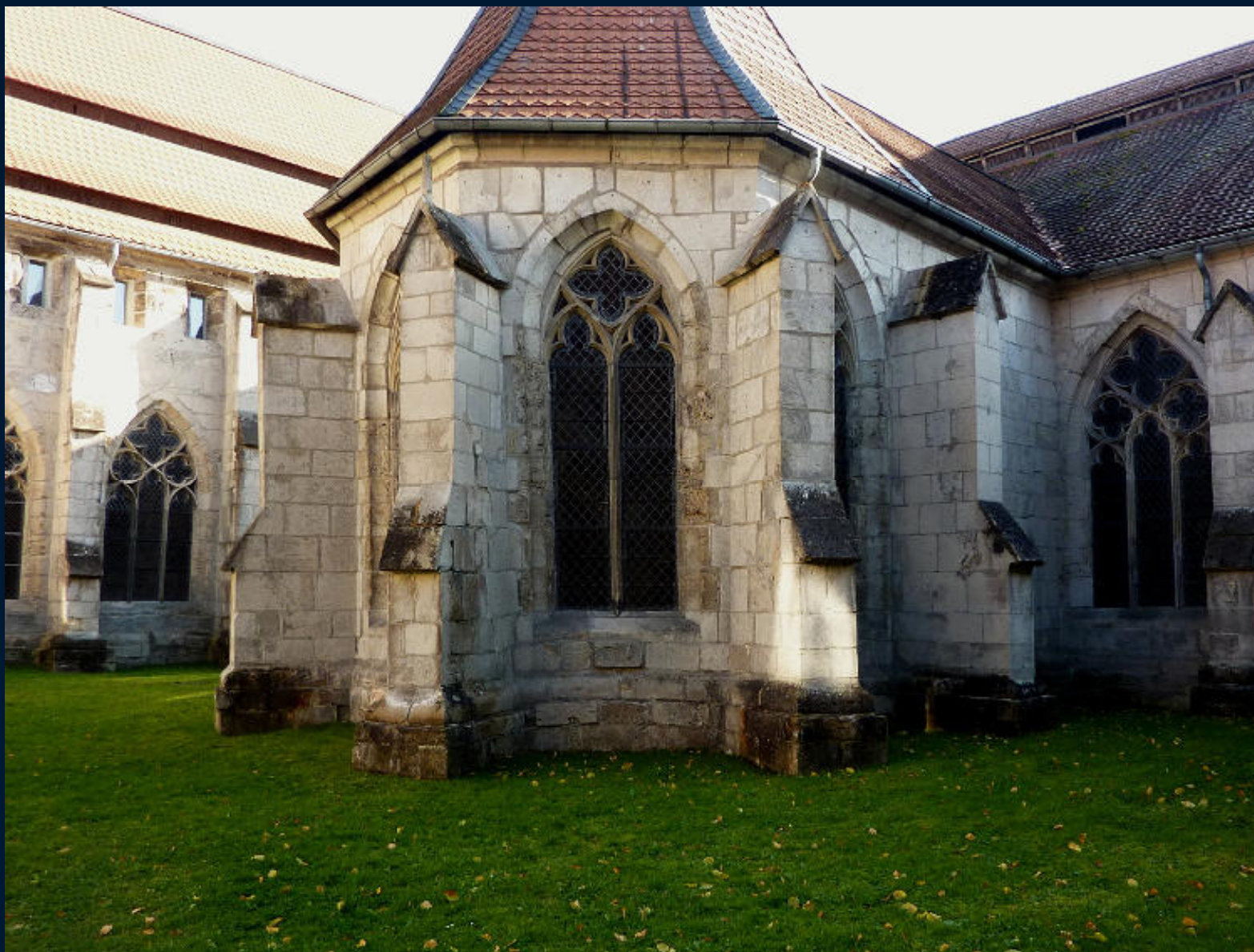
Walkenried – středověký klášter