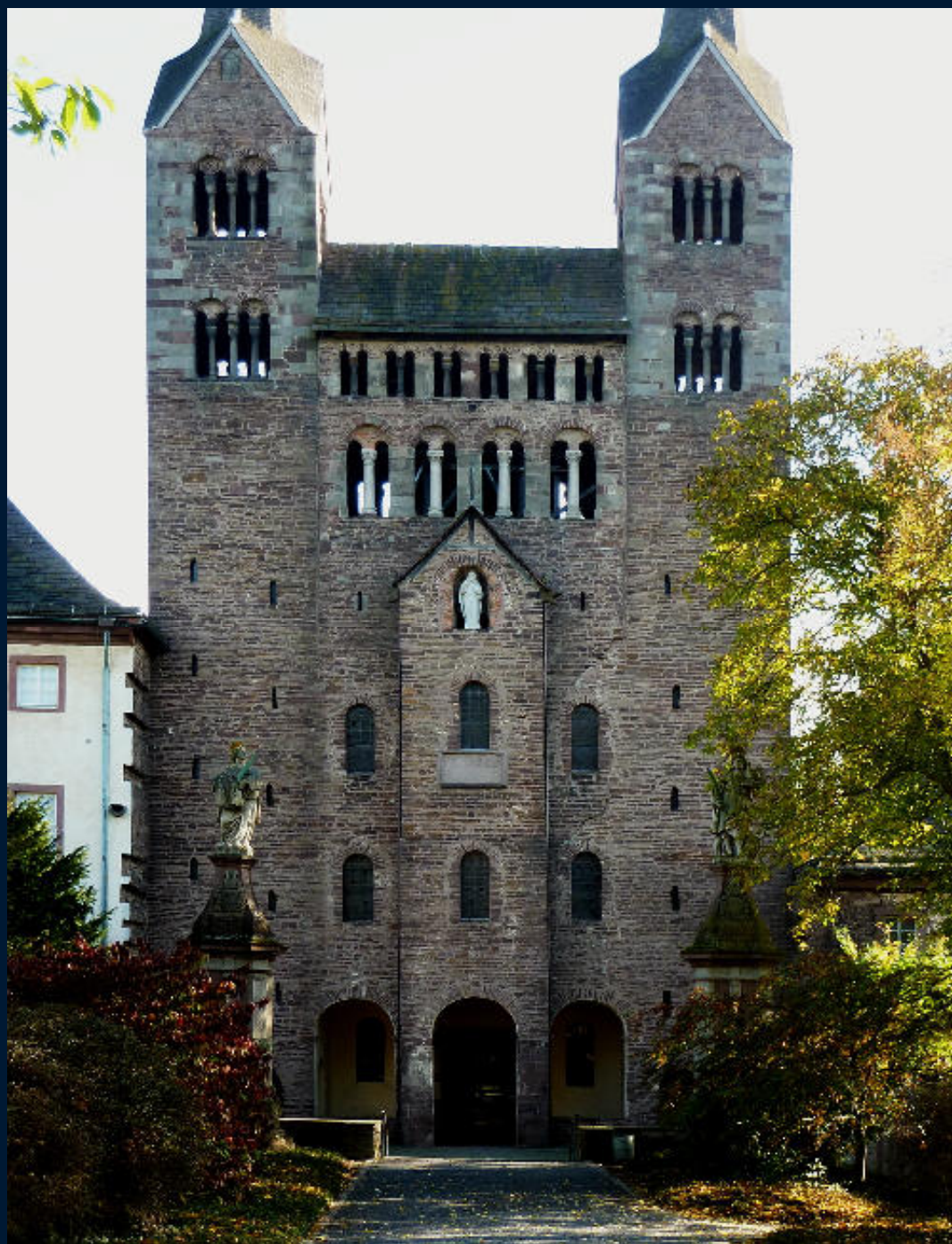
Corvey – benediktinský klášter