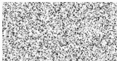
ředitel Územního odboru Teplice HZS Ústeckého kraje

Technické a organizační podmínky připojení EPS na PCO HZS Ústeckého kraje