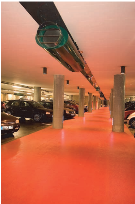
Ukázka JET systému v podzemní garáži