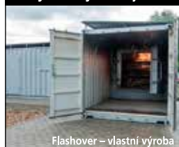
Flashover – vlastní výroba