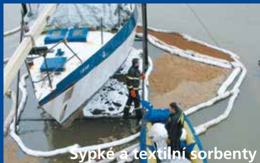
Sypké a textilní sorbenty