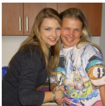
Lucíí, jsi zlato ☺