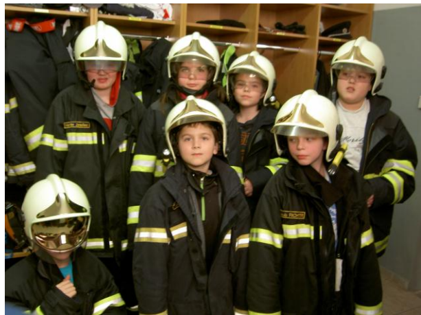
„Malí – velcí“ hasiči