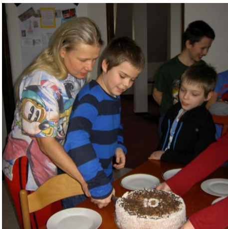
Oslavenci společně krájí dort