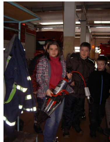
Pánové, takhle se to dělá!