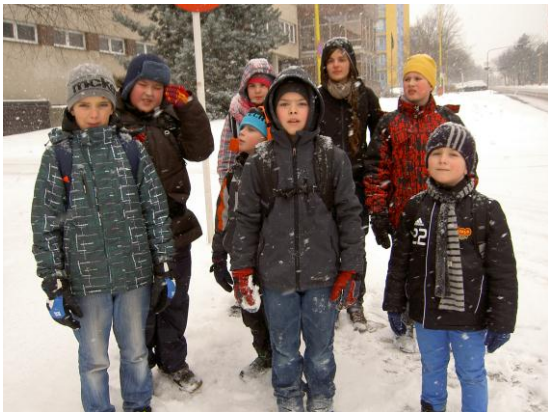
... a chumelí a chumelí a chumelí...