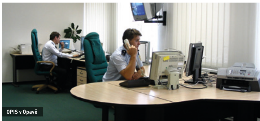
OPIS v Opavě

provoz Integrovaného bezpečnostního centra v Ostravě (IBC). IBC je krajským centralizovaným operačním střediskem, do kterého jsou svedeny všechny tísňové linky složek integrovaného záchranného systému v našem kraji.