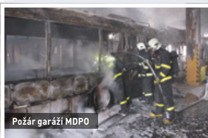
Požár garáží MDPO