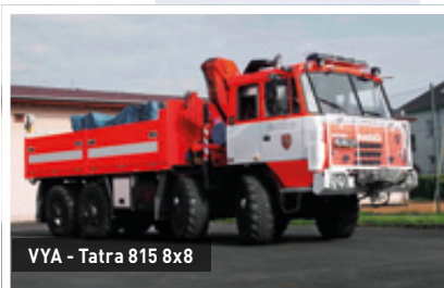
VYA - Tatra 815 8x8