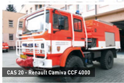
CAS 20 - Renault Camiva CCF 4000