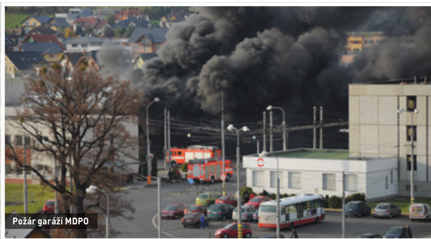
Požár garáží MDPO