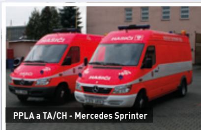
PPLA a TA/CH - Mercedes Sprinter