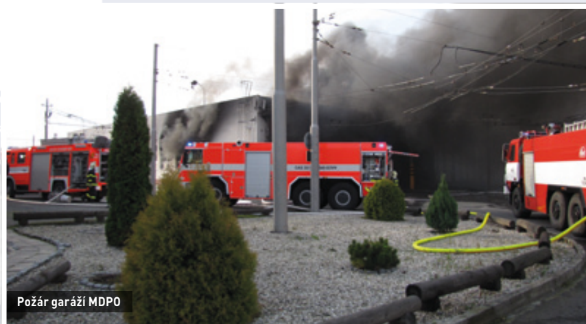
Požár garáží MDPO