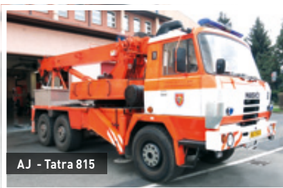
AJ - Tatra 815