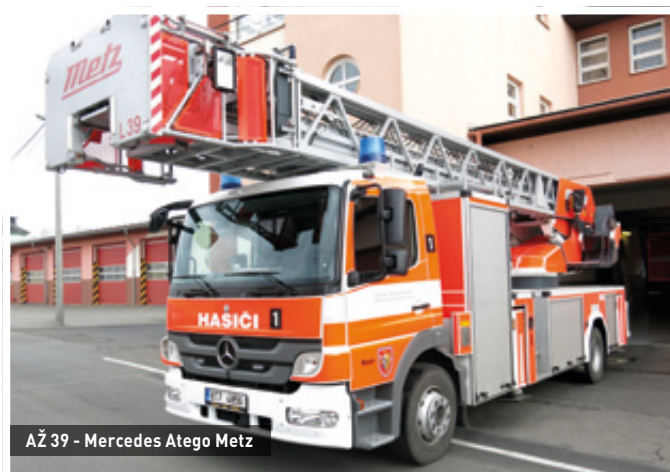
AŽ 39 - Mercedes Atego Metz