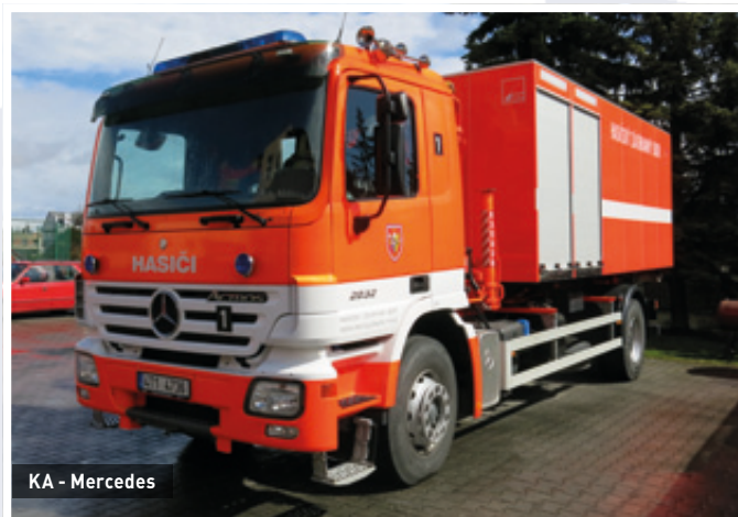
KA - Mercedes