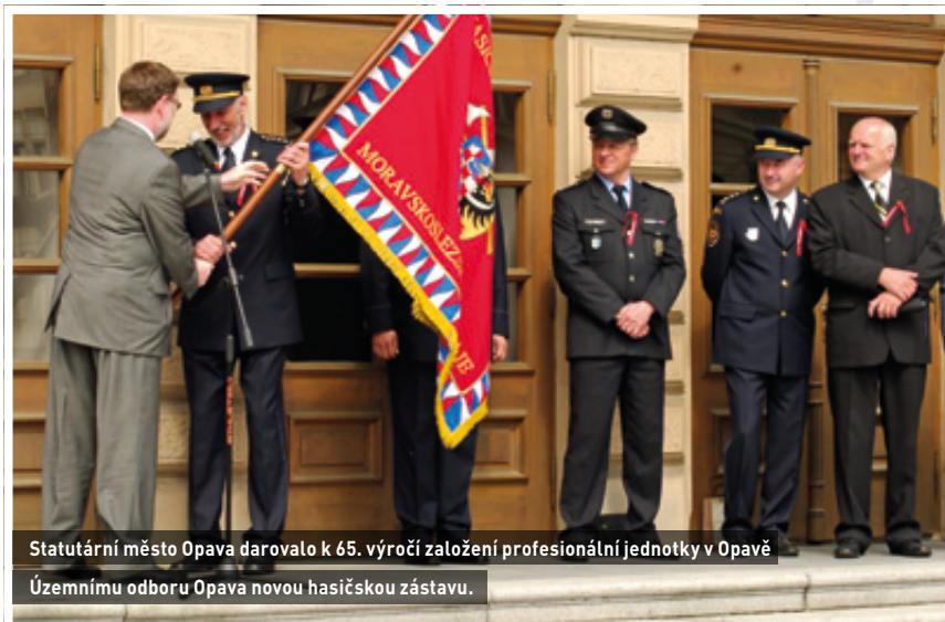
Statutární město Opava darovalo k 65. výročí založení profesionální jednotky v Opavě Územnímu odboru Opava novou hasičskou zástavu.