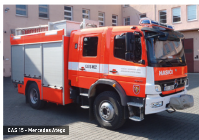
CAS 15 - Mercedes Atego