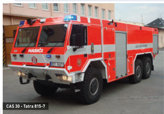
CAS 30 - Tatra 815-7