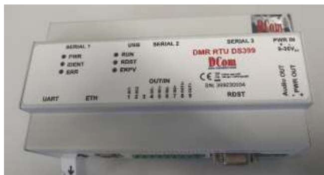
KPPS 2. vrstvy JSVV – řídicí jednotka