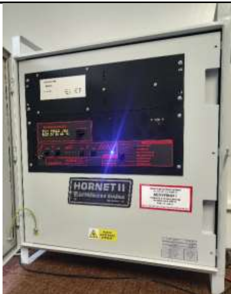
Ovládací panel sirény