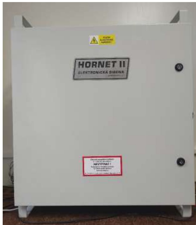
Skříň řídicí elektroniky sirény – uzavřená