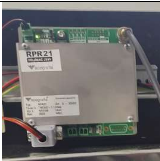
KPPS 1. vrstvy JSVV