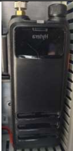
KPPS 2. vrstvy JSVV – radiostanice DMR