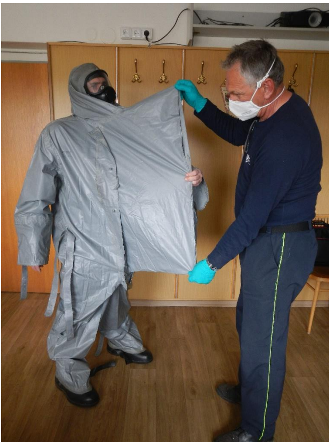
Schéma skládání vstupního tunelu před srolováním.

Připravíme vstupní tunel ke skládání dle schématu.