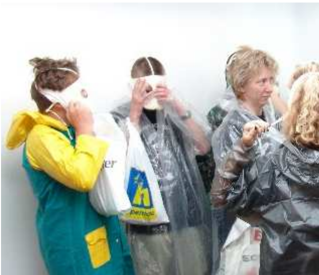
Improvizovaná ochrana při evakuaci