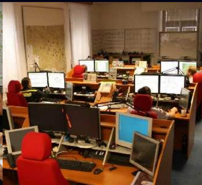
Operační a informační středisko IZS