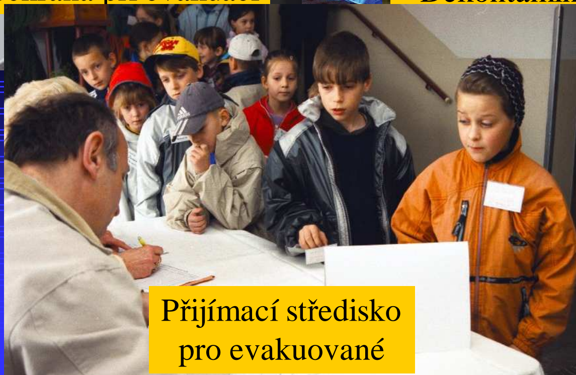
Přijímací středisko pro evakuované