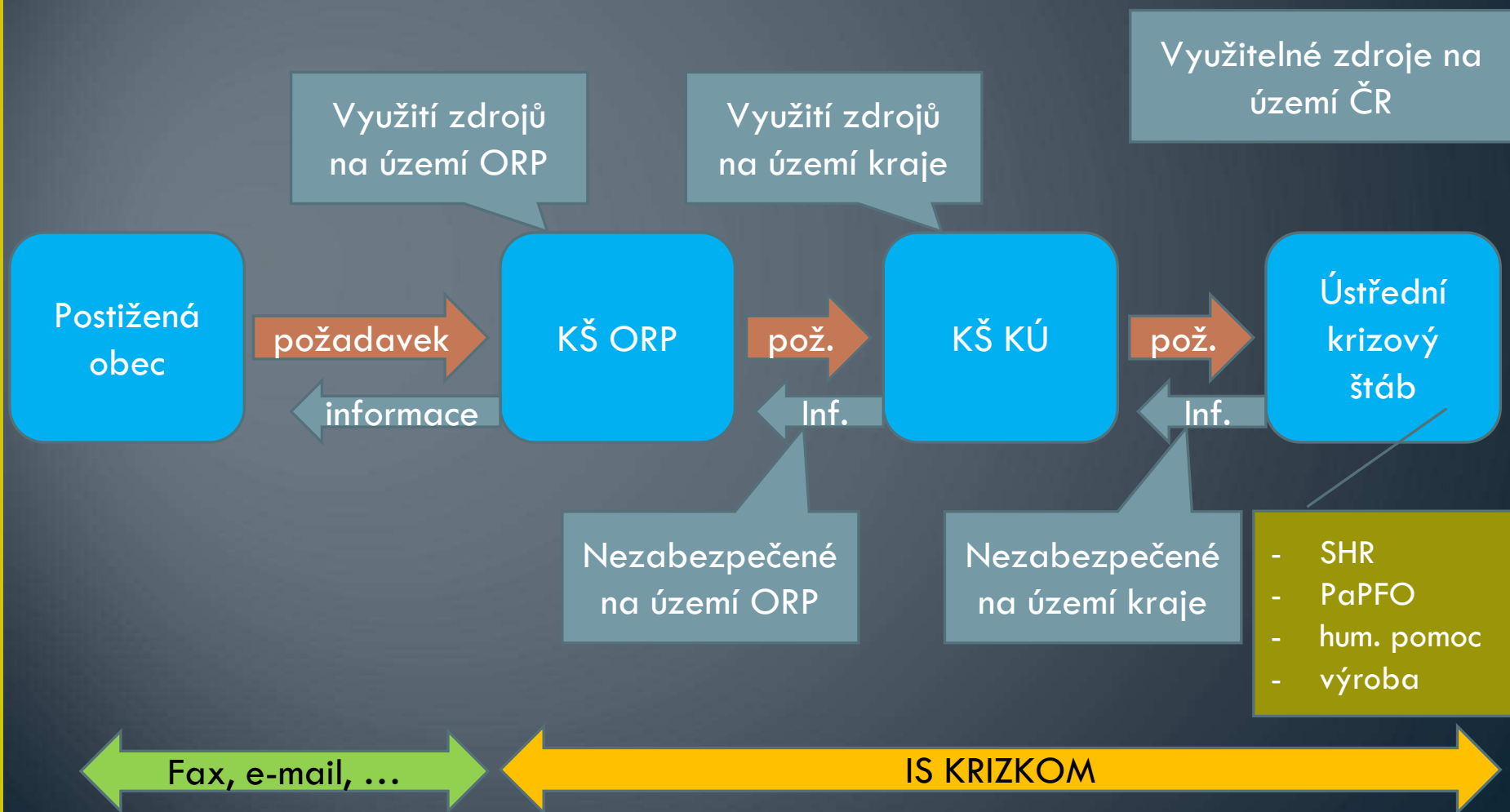
Schéma toku požadavků na VZ