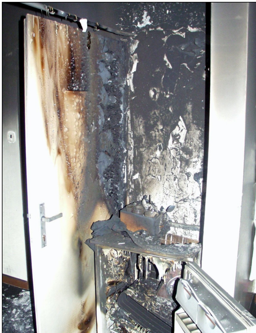
Požár bytu od technické závady ledničky

Při potřebě rychlého rozmrazení vodovodních potrubí a armatur, potrubí ústředního topení apod. nikdy nepoužívejte otevřený plamen. Nejvhodnější a nejbezpečnější je zamrzlé potrubí, armaturu, či další předmět polévat horkou vodou, nebo nám pomůže horká pára. Lze doporučit i elektrické rozmrazování, při kterém se používají speciální rozmrazovací transformátory. Smí se použít jen na kovová potrubí, kde nejsou jednotlivé části izolačně oddělené. Tuto činnost však již smí provádět jen poučená osoba. Další osoba by měla sledovat, nedochází-li k nadměrnému oteplování potrubí, především tam, kde nemáme jistotu, že se nedotýká hořlavých částí objektu, či zda není izolováno hořlavým materiálem.