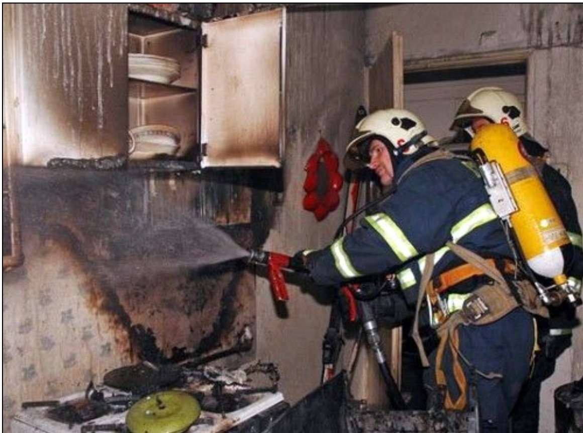
Požár kuchyně od potravin ponechaných při vaření na sporáku bez dozoru

Nejčastěji však požáry vznikají při běžných činnostech, jakými jsou např. vaření, kouření, kutilství, vánoční a jiné výzdoby bytů apod. K předcházení vzniku požárů, snížení jejich počtu a následků je potřeba si uvědomit a domyslet rizika našeho počínání.