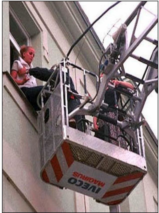
Požáry bytů v bytových domech a záchrana osob