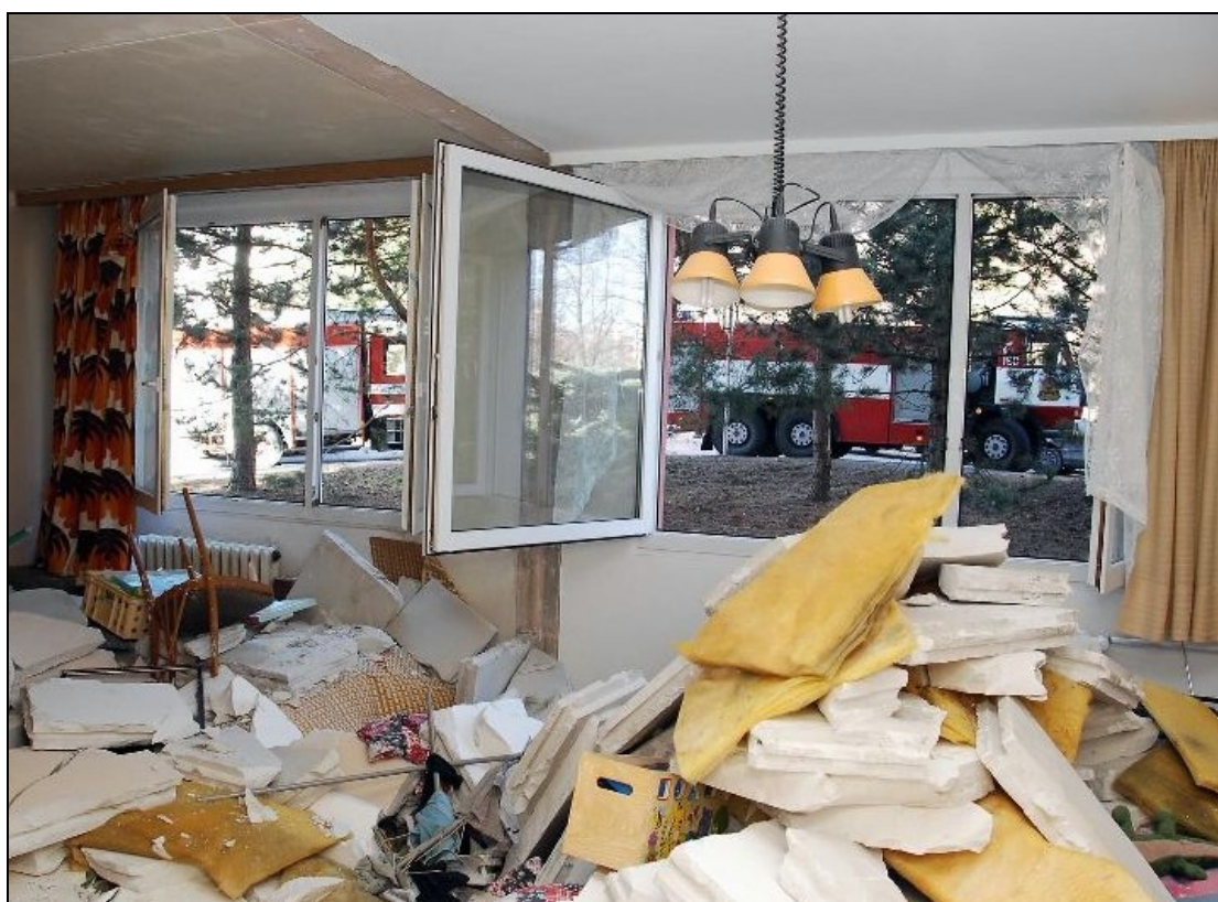
Byt zničený tlakovou vlnou po výbuchu toluenových par při lepení podlahové krytiny