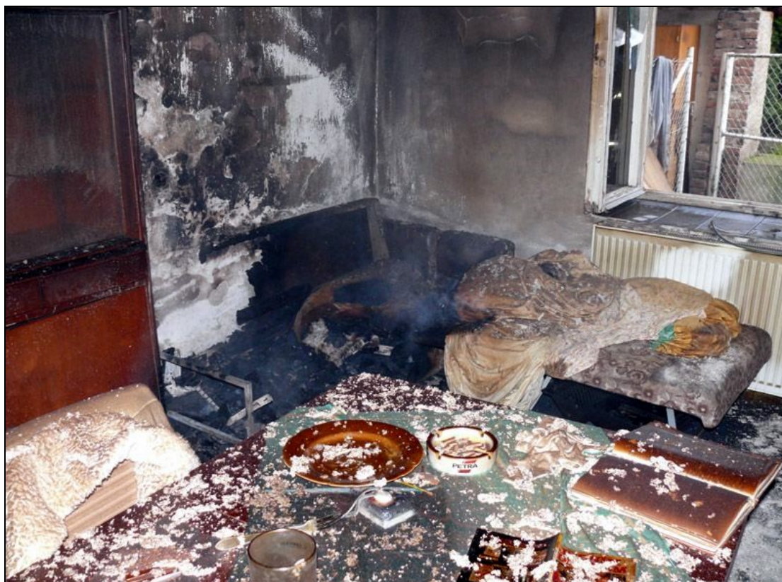
Takto vypadá byt po požáru způsobeném nedbalostí při kouření

Nejobecnějším pravidlem je zabránit možnému samovznícení (ukládáním odpadu a potřísněných látek odděleně do nehořlavých nádob), řádně větrat, případně se vybavit hasicím přístrojem. Vždy je nutné zajistit hořlavý materiál před možným stykem s otevřeným plamenem a při práci nekouřit.