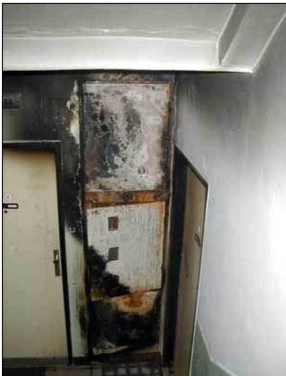
Požár elektrostoupačky v panelovém domě

Skryté nebezpečí představují starší instalační šachty, kterými je do jednotlivých bytů vedena studená a teplá voda, plyn i elektrická energie, odvětrání, a které ještě nemusely mít vyřešeny prostupy jednotlivých instalací požárně dělící konstrukcí. Nelze je považovat za samostatné požární úseky, mj. proto, že jsou z hořlavých materiálů (umakart) a nemají požární uzávěry revizních otvorů. V těchto prostorách by v případě vzniku požáru docházelo k tzv. „komínovému efektu“, a tím k velmi rychlému šíření požáru a zakouření objektu.