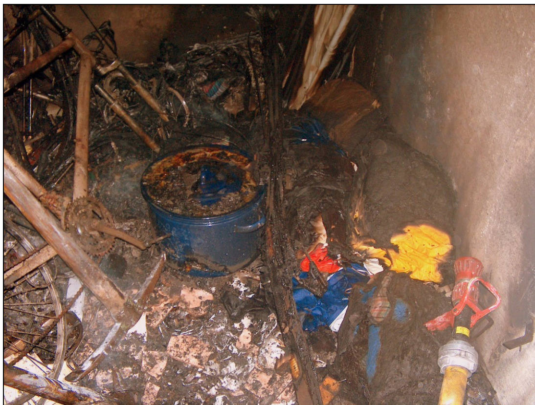
Požár odložených věcí ve sklepní kóji

Sklepní prostory se často stávají nejen odkladištěm již nepotřebných předmětů všeho druhu, ale např. i rezervních pohonných hmot, zbytků barev, ředidel a jiných hořlavých kapalin, které představují značné riziko pro vznik požáru. Hořlavé kapaliny nelze ukládat ve společných a ve sklepních prostorách bytových domů s výjimkou hořlavých kapalin potřebných k vytápění těchto objektů v maximálním množství 40 litrů v přenosných nerozbitných obalech pro jeden tepelný spotřebič.