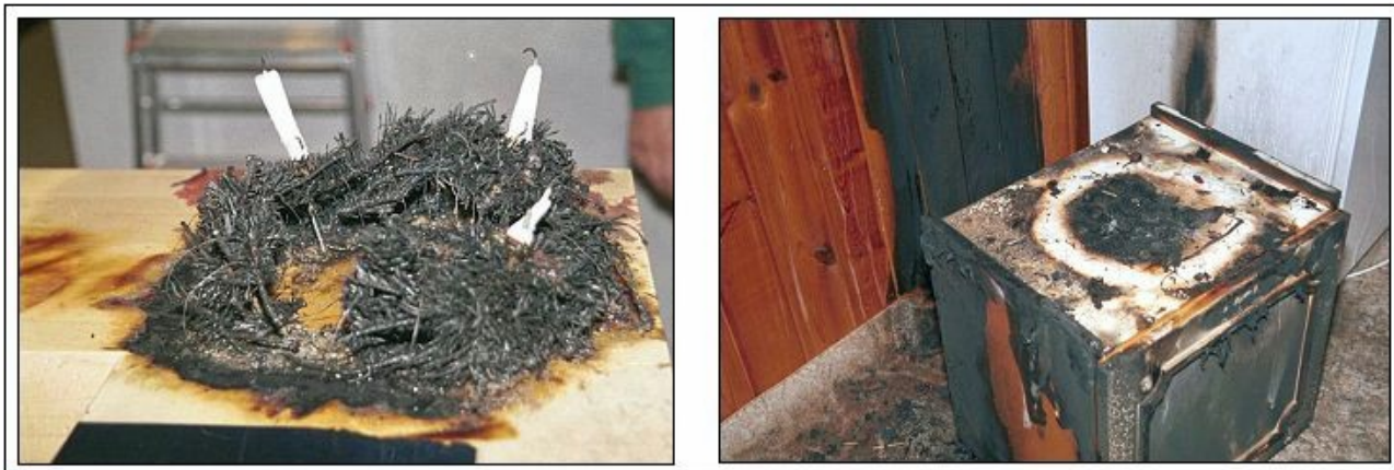
Od adventních věnců vyhořelo již mnoho bytů

Adventní věnec - důležitý je výběr věnce a svíček. Vždy jej ještě podložte nehořlavou podložkou (postačí i talíř). Nikdy ho nenechte zapálený bez dozoru. Neopusťte místnost, dokud se nepřesvědčíte, že jste svíčky správně uhasili a nedoutná jehličí a výzdoba.