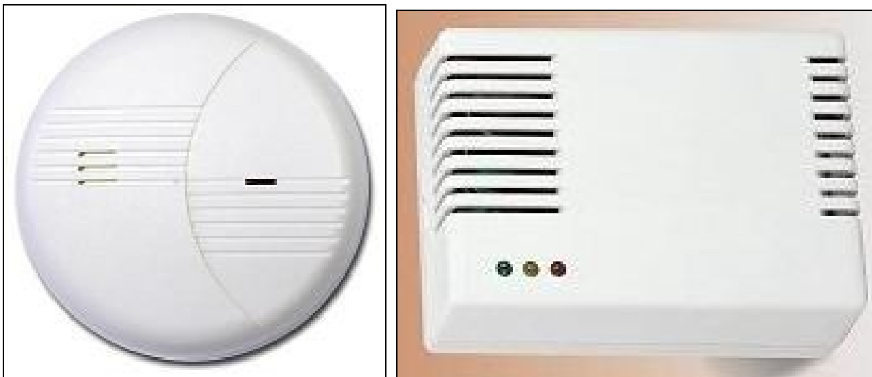
Příklady autonomních hlásičů kouře

Stavby rodinných nebo bytových domů, o jejichž umístění bylo pravomocně rozhodnuto v územním řízení nebo byl vydán územní souhlas podle stavebního zákona po 1. červenci 2008, musí být již zařízením autonomní detekce a signalizace povinně vybaveny 40 . U starších bytů a rodinných domků ji doporučujeme.