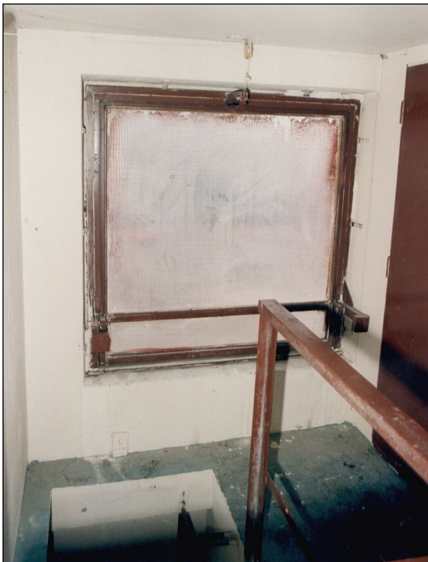
Ručně ovládané klapky pro odvod tepla a kouře jsou velmi často nefunkční

Provozní schopnost instalovaného požárně bezpečnostního zařízení 18 se prokazuje dokladem o jeho montáži, funkční zkoušce, kontrole provozuschopnosti, údržbě a opravách provedených podle podmínek stanovených výrobcem a také záznamy v příslušné provozní dokumentaci (např. provozní kniha).