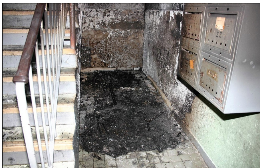
Odhozený nedopalek způsobil požár odložených věcí na chodbě panelového domu

Společné prostory bývají někdy částečně zastavěny vybavením, které je má „zkulturnit“ nebo které se tzv. do bytové jednotky nevešlo či je již nadbytečné. Tím je zúžena vlastní úniková cesta a také zvýšeno riziko vzniku požáru (zvýšením požárního zatížení).