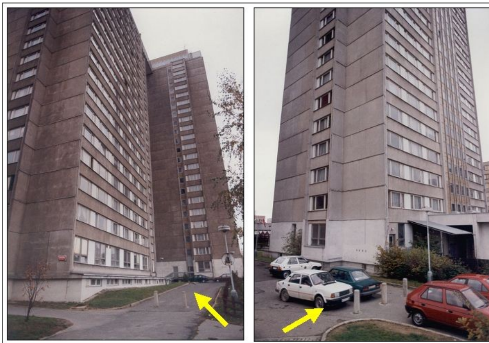
Na označených místech mají být volné nástupní plochy pro hasičskou techniku

V současné době se setkáváme s překážkami bránícími příjezdu požární techniky (např. závory, oplocení, brány na čipové karty). Někteří majitelé pozemků kolem bytových budov tak řeší ochranu svého majetku nebo přímo provozují parkoviště. Chtěli bychom upozornit, že toto jednání je v příkrém rozporu s požadavky požární ochrany a může být příčinou znemožnění rychlé pomoci hasičů a záchranářů.