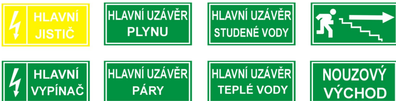
Příklady bezpečnostních tabulek

Většina občanů si instalaci výše uvedených zařízení a jejich prvků ve stavbě ani neuvědomuje. Pokud není ovládání zařízení zajištěno automaticky (např. spuštěním přes EPS), je nutné, aby k ovládacím prvkům byl zajištěn volný přístup. Všichni, kdo se v bytovém domě nacházejí musí být informováni o jejich rozmístění a hlavně způsobu použití v případě požáru. Proto musí být vždy viditelně označena a opatřena pokyny pro rychlé použití v českém jazyce 43 . Nezapomeňte na řádné označení: hlavních uzávěrů médií, evakuačních cest, směrů úniku a únikových východů a nástupních ploch.