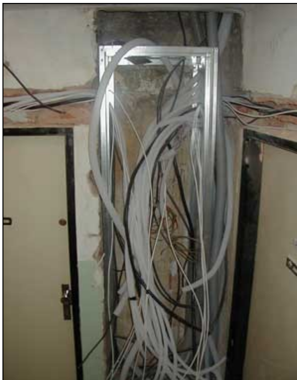
Rekonstrukce domovního elektrorozvodu

Ve staré zástavbě dochází poměrně často k požáru ve světlíkové šachtě, kdy v 90 % případů je požár iniciován neuhášeným nedopalkem cigarety, vyhozeným z WC do nevyklizeného smetí na dně šachty.